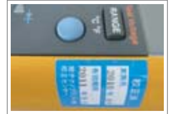
※校正完了品には「校正ラベル」を貼付いたします。