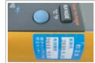
※校正完了品には「校正ラベル」を貼付いたします。